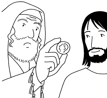
Cette effigie et cette légende de qui sont-elles? Matthieu 22, 20