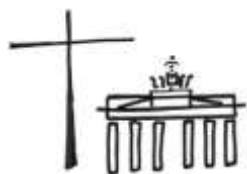
St Thomas d'Aquin