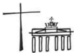
St Thomas d'Aquin