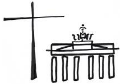
St Thomas d'Aquin